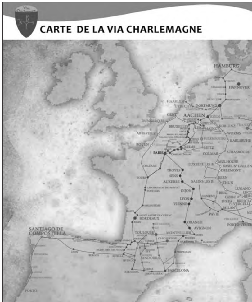
Figura 1 Mapa de la Via Charlemagne (parte occidental)