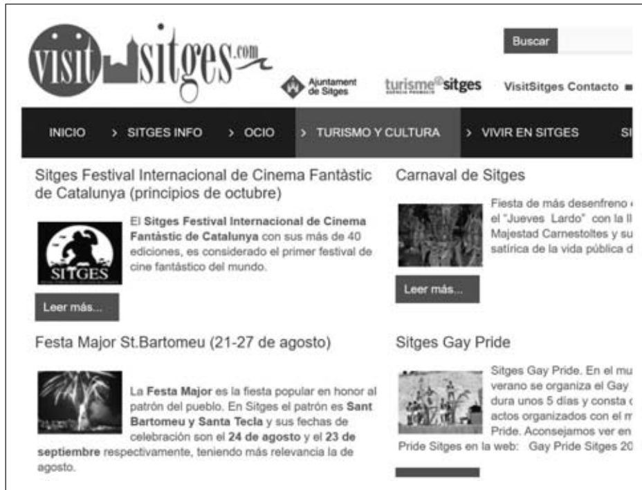
Figura 3 Acceso al Festival de Sitges en la web turística del destino