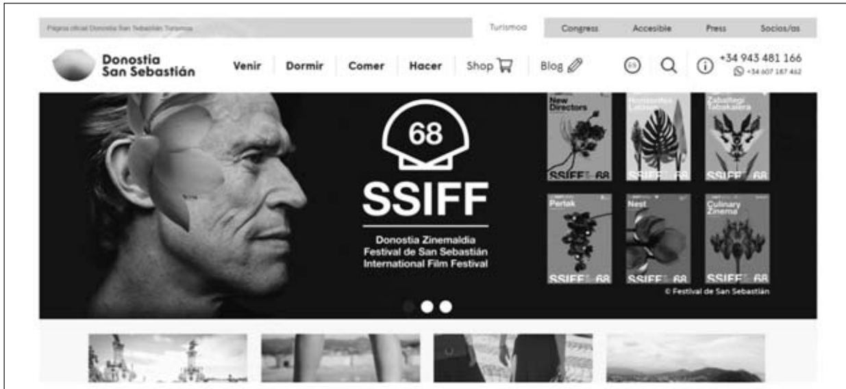
Figura 2 Portal de turismo de San Sebastián