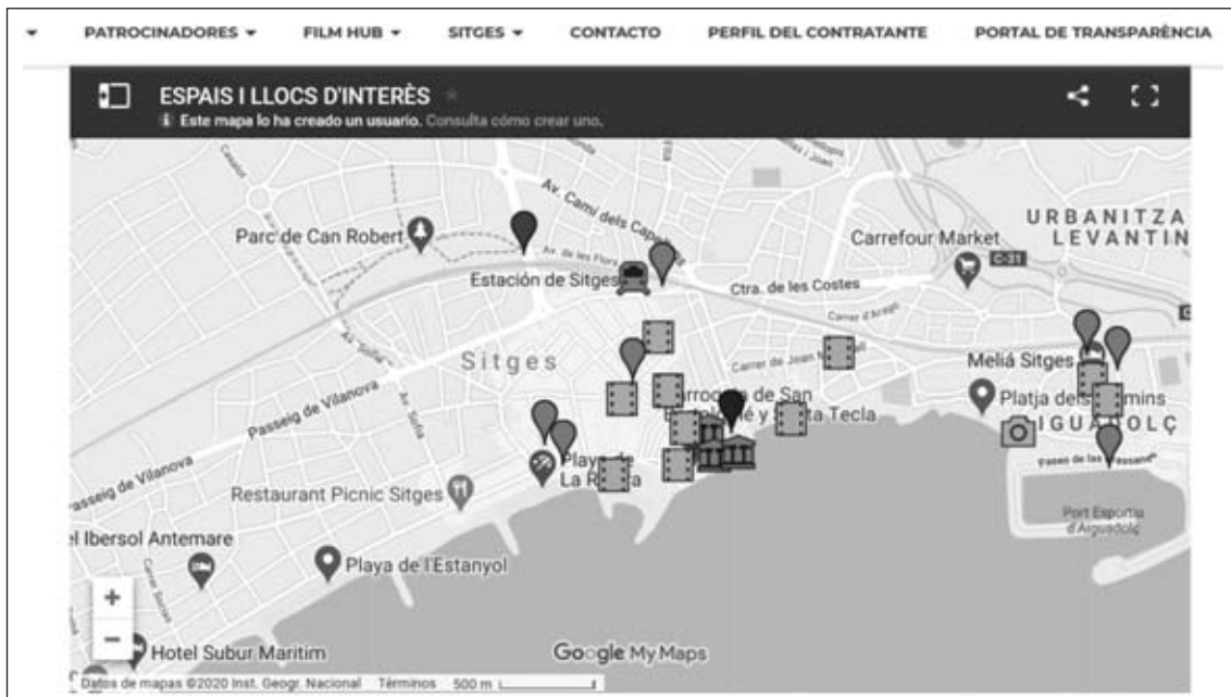
Figura 7 Mapa lugares de interés de Sitges

El Festival de Sitges (Festival Internacional de Cine Fantástico de Cataluña), al igual que los dos anteriores, hace honor a su destino usándolo como nombre del mismo. Además, en la propia web de inicio, en la cabecera de submenús aparece Sitges. Al desplegar dicho submenú se puede clicar en “Sitges recomienda”, ante lo cual aparece un listado de establecimientos de alojamiento recomendados. En el mismo submenú, además de los alojamientos, se puede acceder a Sitges, Port D’aiguadolç y Fanshop area. Accediendo a Sitges se muestra un párrafo con información de la villa, además de 4 apartados: cómo llegar, el puerto, establecimientos recomendados y la villa. Asimismo, para más información se muestra el link www.sitgestur.cat , el cual