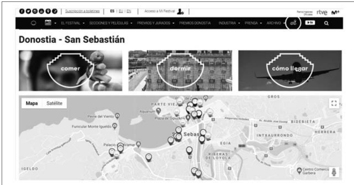
Figura 6 Información sobre San Sebastián en la web del festival

no existe en la web, ya sea en la del propio festival o en el menú de información del destino, son productos ya paquetizados, sino que se indica información de recursos, transportes y alojamiento. Por último, desde la web del festival se puede acceder a 5 redes sociales creadas exclusivamente para este evento: Facebook, Twitter, Instagram, YouTube y, como novedad hasta el momento, Periscope. En esta última hay un total de 20 transmisiones, más de 3.300 seguidores y más de 66.000 me gusta. En el caso de Facebook, más de 56.000 personas siguen la página. Solo en la biografía se han subido más de 2.700 fotos, además de vídeos y álbumes específicos. En Instagram también son bastante activos, con más de 1.700 pu-